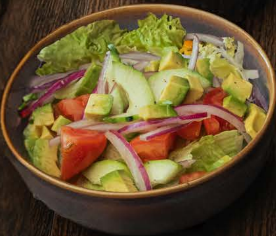
ENSALADA DE LA CASA