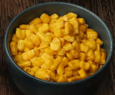
ELOTES A LA MANTEQUILLA