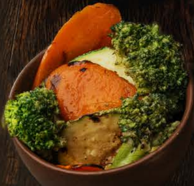
VEGETALES A LA PARRILLA