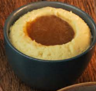
PURÉ DE PAPA JALAPEÑO