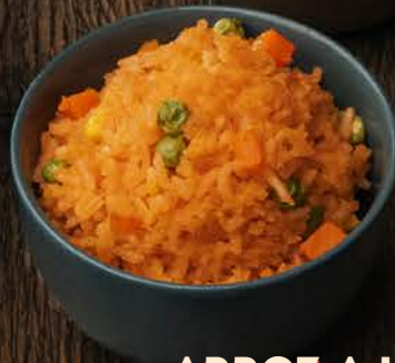
ARROZ A LA MEXICANA