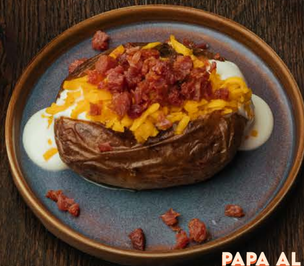
PAPA AL HORNO